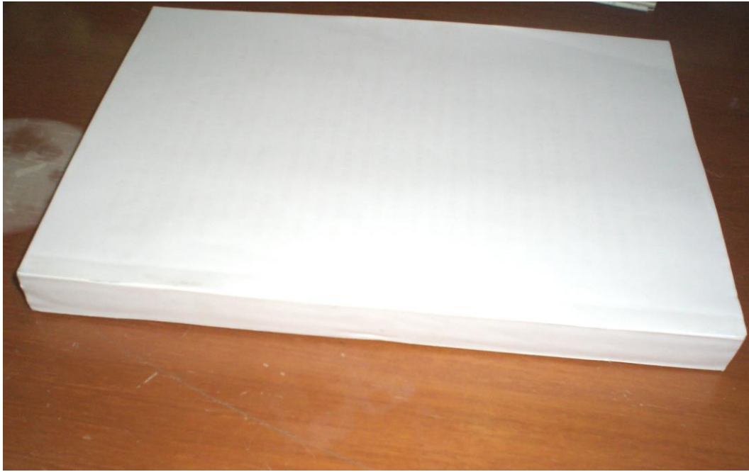
(注：上图为正确的封底格式)